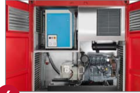
6 Teknik oda