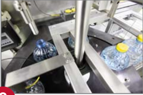
3 Dolum ve kapatma