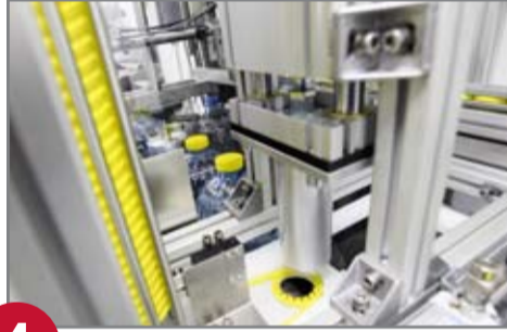
4 Tutamak aplikatörü