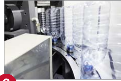
2 Ön kalıptan şişeye veya Şişe üretimi