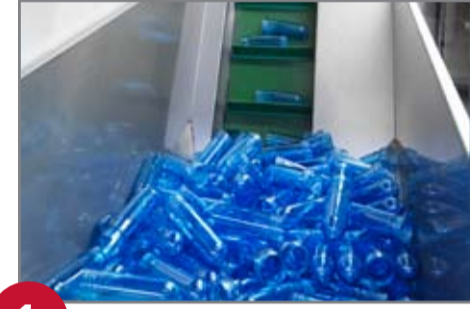
1 Ön kalıp fideri